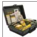
SamplerPak, motorisert pumpe